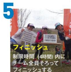
5 フィニッシュ 制限時間 (4時間) 内に チーム全員そろって フィニッシュする