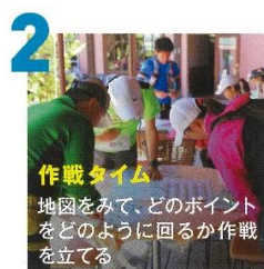
2 作戦タイム 地図をみて、どのポイント をどのように回るか作戦 を立てる