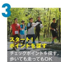
3 スタート! ポイントを探す チェックポイントを探す。 歩いて走ってもOK