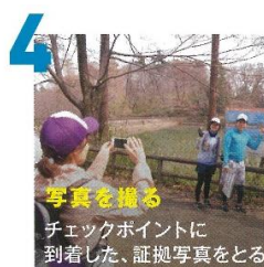
4 写真を撮る チェックポイントに 到着した、証拠写真を撮る