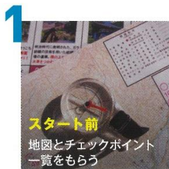
1 スタート前 地図とチェックポイント 一覧をもらう

親子や友達などでチームを組んで挑戦！ 子供から大人まで楽しみながら、 地域のスポット(チェックポイント) を巡るゲーム感覚のスポーツです。