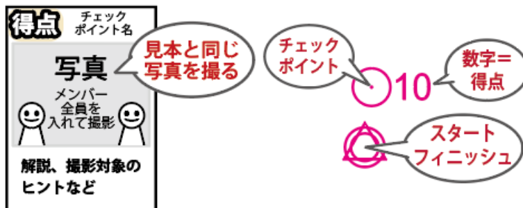
地図とチェックポイント一覧の例